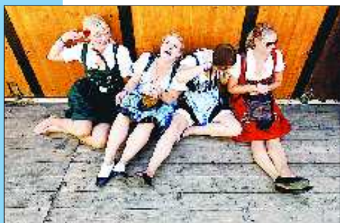
【德国 慕尼黑啤酒节】 第178届慕尼黑啤酒节开幕,将持续到10月3日。去年啤酒节共消费了710万瓶啤酒。