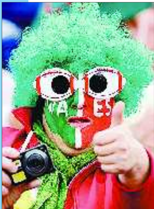
【新西兰 橄榄球世界杯】 9月18日,球迷在观看橄榄球世界杯赛。本届橄榄球世界杯在新西兰奥克兰市举行。