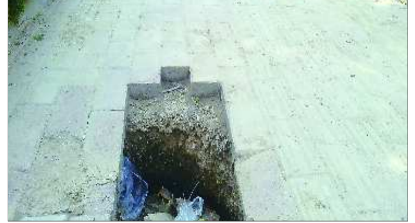
26日,在日照市人民医院西侧的人行道出现塌陷,形成一个长约一米的土坑。由于土坑在医院附近,人流量较多,给行人带来不便。