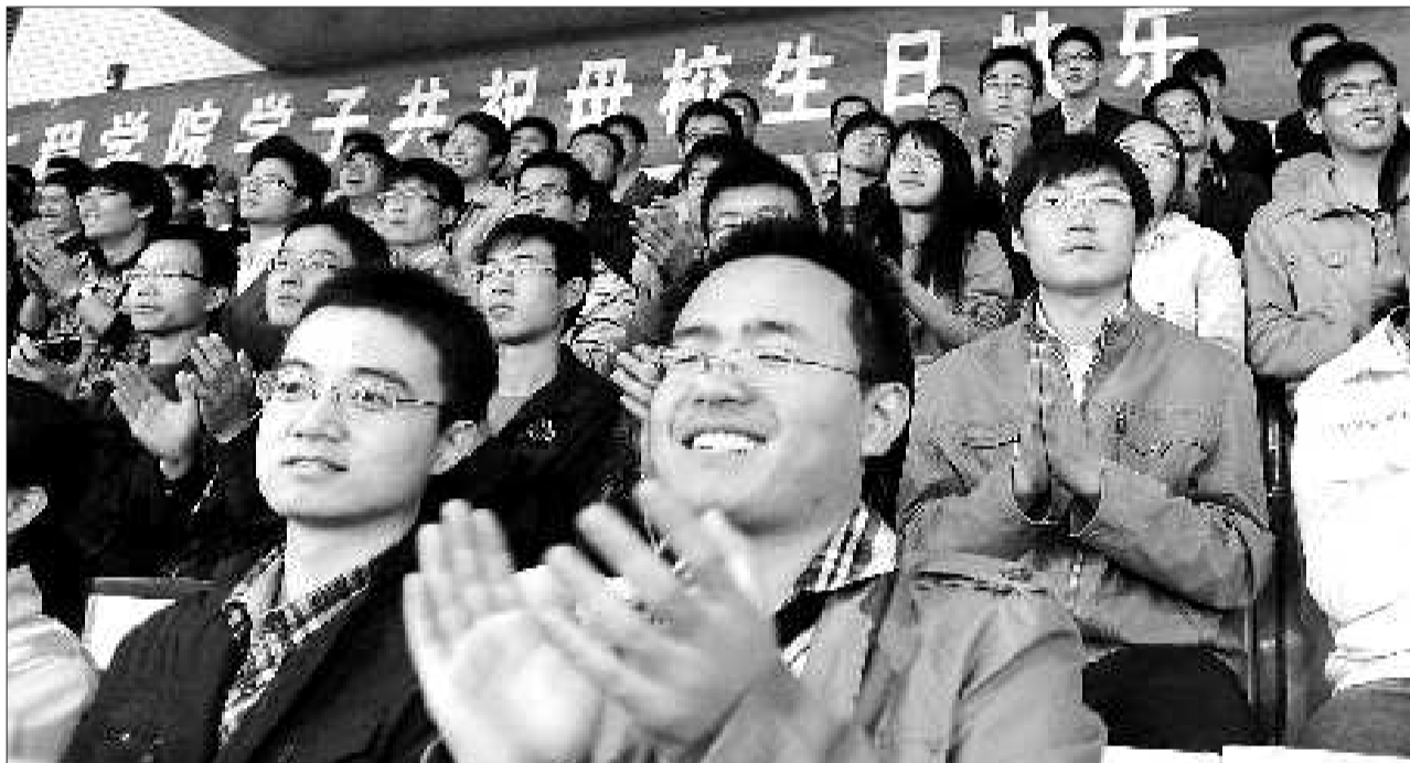
15日,山东大学110周年校庆典礼上,山大学子们打出横幅,祝“母校生日快乐”。