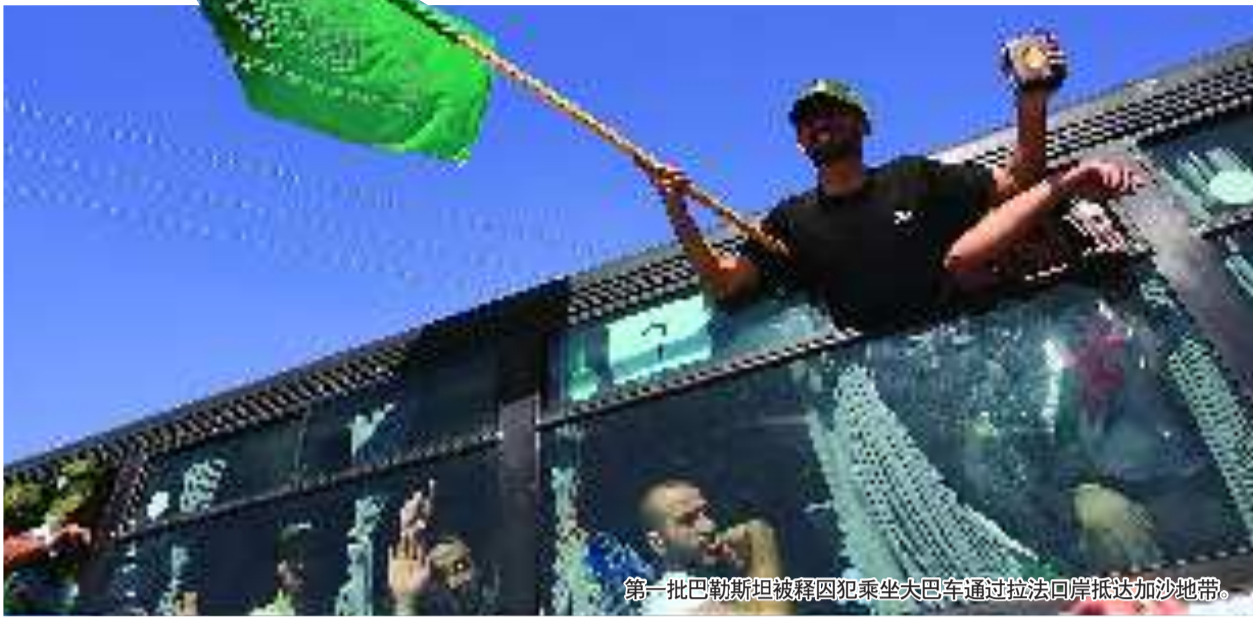
第一批巴勒斯坦被释囚犯乘坐大巴车通过拉法口岸抵达加沙地带。

以色列当局18日释放477名在押巴勒斯坦人员,同一天,被巴勒斯坦伊斯兰抵抗运动(哈马斯)关押5年多的以军士兵沙利特也获释回国。这标志着巴以第一阶段换俘行动顺利实施。报道指出虽然以方是用1027名巴囚犯换取士兵沙利特1人,看似“赔本”,但由于双方背后各有考虑,实际上达成了一场互惠互利的“政治交易”。