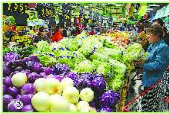
图②: 18日, 在历山路一家超市内, 市民正在挑选蔬菜。