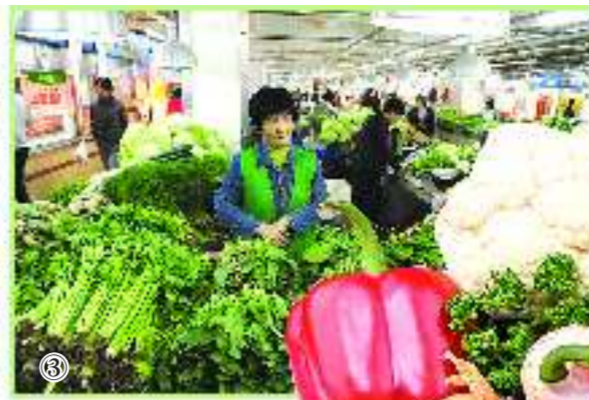
图③: 十亩园蔬菜早市, 一米左右的摊位每月的摊位费在300元左右。