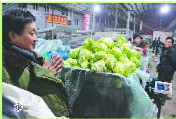
图①: 18日凌晨, 在匡山农产品综合批发市场, 菜农开始卖菜。

另外, 还有不少市民担心, 现在一些地方已经配备了农贸市场或者小超市, 如果蔬菜直销点设在这些市场和超市附近, 容易引起业户的反感, 担心出现恶性竞争之类的事情。