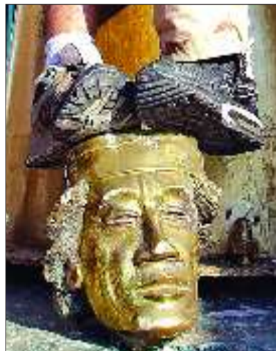
2011年8月23日，反对派攻入卡扎菲政权中枢——阿齐齐亚兵营，捣毁卡扎菲的雕塑。