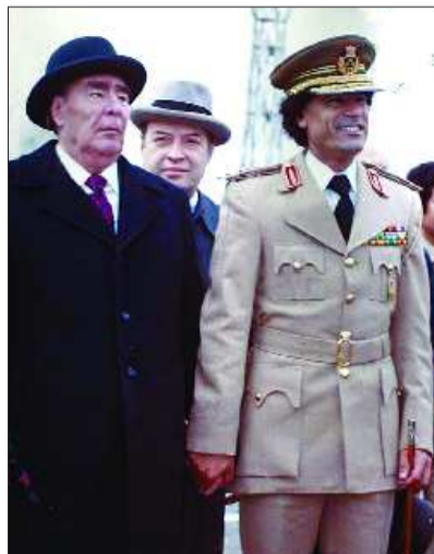
1981年4月27日，卡扎菲抵达莫斯科机场，与勃列日涅夫会晤。