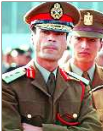
1969年，出访苏丹途中，卡扎菲与军官们在一起。