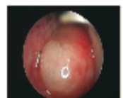
治疗前鼻腔全部堵塞