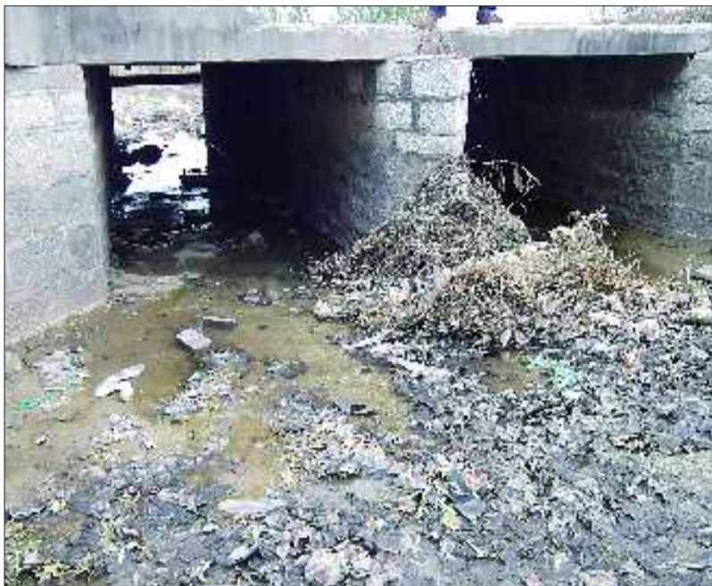
桥中间护栏缺失,桥下留下了电动车碎片。

“她说过桥的时候,车子骑得也不快,不知咋的就掉了桥下。”秦先生说,“如果桥上有个护栏,可能就出不了这个事了。”