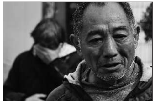
邻居都为这个苦命的家庭难过。