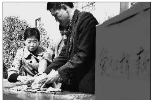
工作人员正在清点捐款数额。