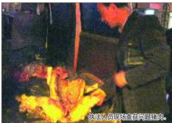
执法人员现场查获问题猪肉。

记者从执法部门了解到,自10月份开始,商务部、公安部、农业部、工商总局、质检总局、食品药品监管局等六部门