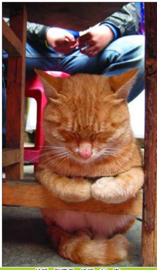
编辑：张满元 组版：刘 宾