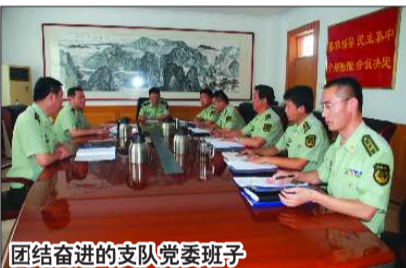
团结奋进的支队党委班子