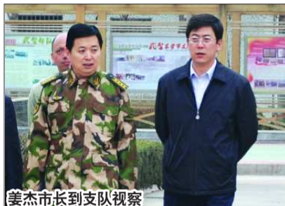
姜杰市长到支队视察