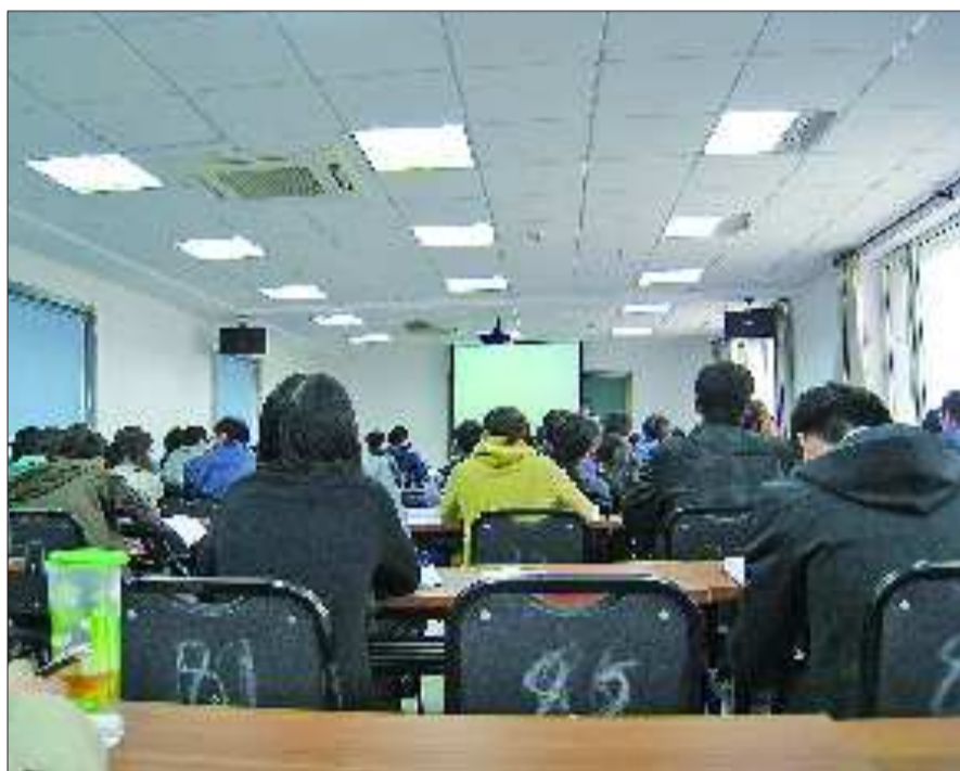
随着国家公务员考试的临近,辅导班也开始忙活起来。

随着国考报名缴费的进行,公务员辅导班又忙活起来。报这些辅导班真的能获取考公“真经”吗?所谓的资深专家又有何特殊来历?他们是如何获取“秘籍”传道解惑的?本报记者进行了调查。