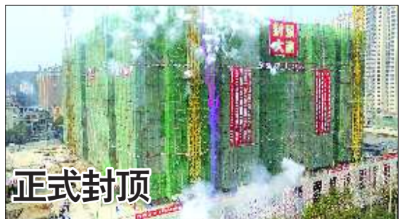
29日上午10点58分, 烟台毓璜顶医院新建医疗大楼上空燃放礼炮, 正式封顶, 该医疗大楼明年元旦前后将正式投入使用。

据介绍, 目前仍未签订补偿协议的被征收人, 在接到《烟台市芝罘区人民政府房屋征收补偿决定》之日起, 在限定期限内可以到指挥部(胜利路61号)办理征收补偿手续。逾期不办理征收补偿手续, 芝罘区政府将按照《国有土地上房屋征收与补偿条例》第二十八条依法向人民法院申请强制执行。