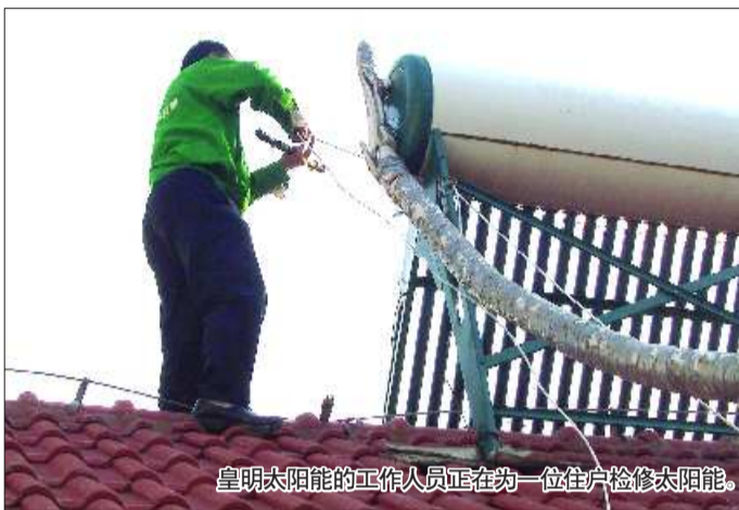
皇明太阳能的工作人员正在为一位住户检修太阳能。

本报10月30日讯(见习记者 齐金钊 尹海涛) 自本报24日联合皇明太阳能烟台总代理发起“我帮你家太阳能过冬”活动以来, 受到了市民的广泛关注。短短几天以来, 本报已陆续接到上百个市民打来的报名电话。29日、30日, 记者跟随皇明太阳能的工作人员, 为最先报名的30多名市民进行了集中上门检修。