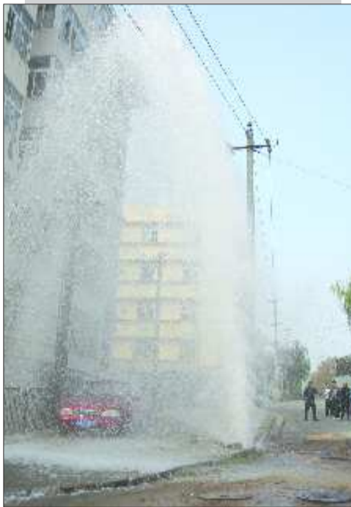
事发时水柱超过四层楼高。

30日11时30分左右,在四方区吉水路东端靠近四方车辆技校的路边,一根直径100毫米的消防栓被一辆福田货车撞断,肇事司机将车开进附近厂房试图逃避责任,不料有市民目击肇事车辆,警方根据车斗内的积水将肇事车辆锁定,司机承认撞断消防栓的事实,目前他将面临多项赔偿。