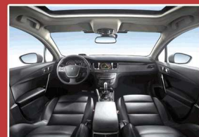
内饰考究耐用,富有极强的科技感

另外,东风标致508汲取标致品牌120年来对于造出“最安全汽车”的技术精华,配合最先进的科技性安全装备,对车内及车外成员起到全方位的周到安全防护。特别在被动安全方面,东风标致508采用了顶级钢板材质,最高强度可达1600Mpa。通过欧洲最新安全标准的安全舱式立体防撞设计,保证了在发生碰撞时对驾乘人员及行人的全方位呵护。此外,东风标致508将乘车儿童的安全放在前所未有的高度,全系标配电子儿童安全锁及2个后座ISOFIX3点固定安全带,在体现整车品质的同时也彰显出企业的社会责任感。