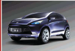
理念第一款概念车型