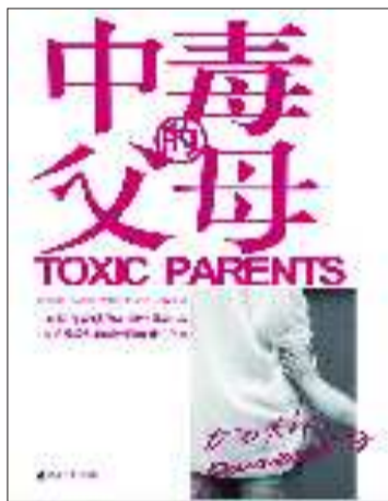
◆书名:《中毒的父母》 ◆作者:[美]苏珊·福沃德 克雷格·巴克 ◆出版社:辽宁教育出版社

我结婚几年以后,母亲得知自己患了动手术也无济于事的癌症。她让家里每一个人都当着她的面起誓,她死的时候决不告诉我。直到五个月后来我碰到的一个朋友,人家向我表示哀悼时,我才知道这件事。就是这样知道母亲的死讯的。我径直回家去找父亲。