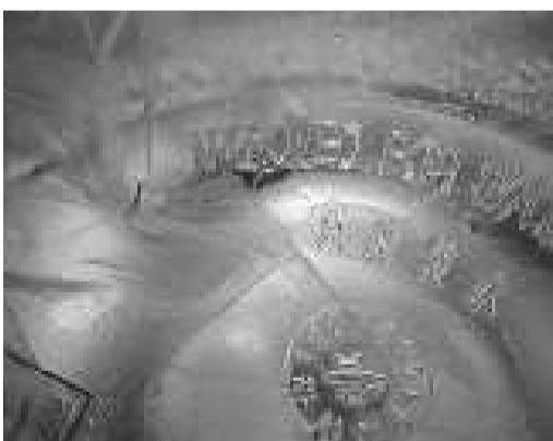
真正的崂山PC桶底有“只能装水”字样