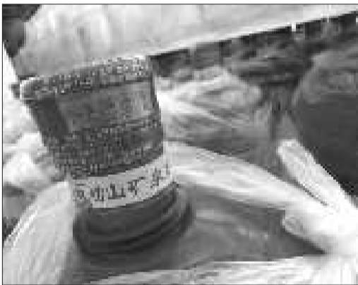
真的崂山水桶都有一个专有的自动喷码,像身份证号一样