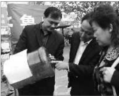
1日上午,在中和园社区,潍坊水协的工作人员正在向居民讲解辨别真假桶装水的相关知识。