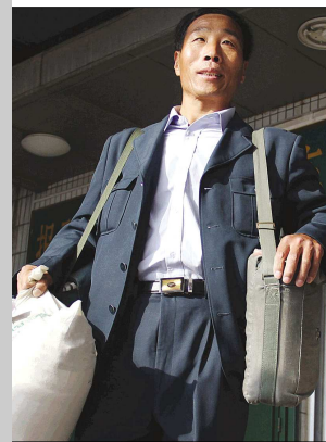
背上 60 斤重的邮件出发了。