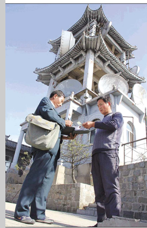
邮件送到山顶的转播台。