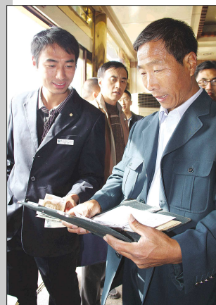
送完邮件他还帮山上的人交话费。