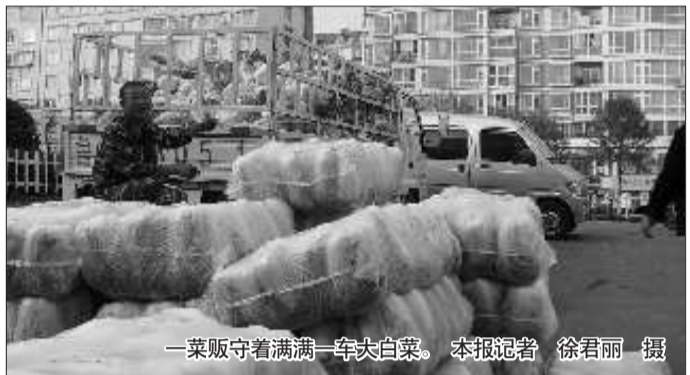
一菜贩守着满满一车大白菜。

本报威海11月1日讯(记者 许君丽 林丹丹) 眼下正是大白菜陆续上市的时候,但与去年白菜价格一路走高的行情不同,由于种植面积扩大、产量增加等原因,今年的白菜价格一路狂跌。有的菜贩算了一笔账,运东北白菜来威海卖,其实是一个赔本买卖。