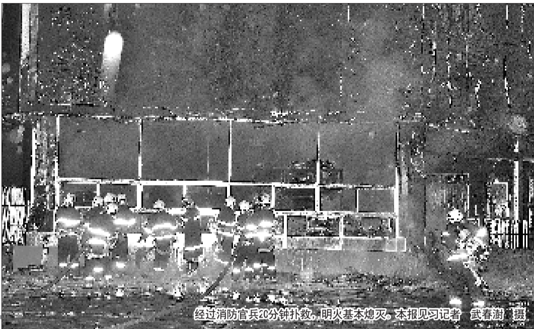
经过消防官兵20分钟扑救,明火基本熄灭。

7日晚上9点25分左右,位于市中区龙头路与振兴路交叉路口的一家名为“桃酥大王”的糕点店突然起火,在大约半小时时间内,大火将整个店铺烧毁,火势还蔓延到旁边的一个茶馆,消防官兵经过约20分钟的扑救将大火扑灭。