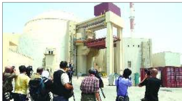
外拍照。记者在伊朗布什尔核电站反应堆 ▲图为2010年8月21日摄影

国际原子能机构(IAEA)8日发布一份报告,称可靠信息表明,伊朗与核武器研制相关的活动可能仍在继续。伊朗方面随即表态,称公布报告出于“政治动机”。