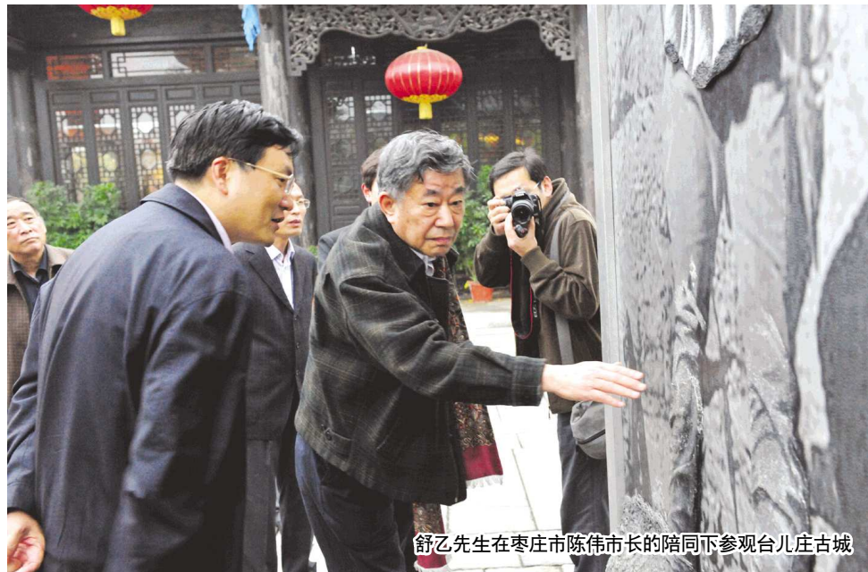
舒乙先生在枣庄市陈伟市长的陪同下参观台儿庄古城

店。店里的商品，虽然设计变了，但工艺没变，在传统基础上融入现代元素，很符合现代人的喜好，这是一个非常正确的发展方向。中国既要保护原有传统，又要满足现代需求，怎么做？这么做！非物质文化遗产的保护和发展，要走向一个光明的未来，怎么走？这么走！就像刚才我们看到的那个非物质文化遗产传承人，他有手艺，但没有市场，生活都没有出路。而在这里，他一天可以赚一千元钱，一个月可以赚两三元钱，很不得了。古城重建创造了商机，为非物质文化遗产传承人找到了生活出路，激活了这些非物质文化遗产，很有启发性。