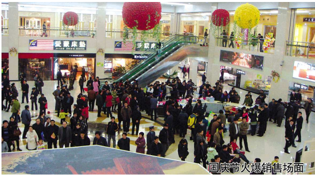
国庆带火爆销售场面

随着冬日脚步的逼近,家的概念愈发温暖,居然之家槐荫店特在这个深秋的季节里推出大型工厂直销回馈活动,用最优惠的家居产品温暖这个冬天。笔者从居然之家槐荫店了解到,工厂直接进驻店面,让消费者与工厂面对面,缩去价格水分,一价到底。