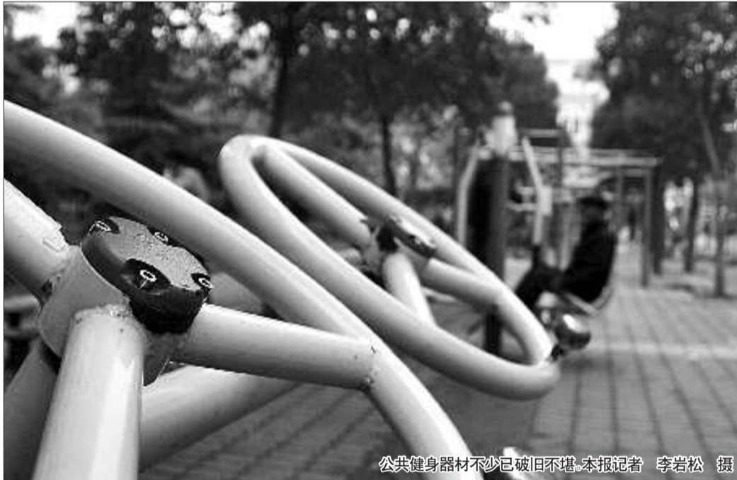
公共健身器材不少已破旧不堪。

本报济宁11月9日讯(记者 孔令茹) 扭腰器、漫步机、双位荡板……公园、小区内的这些公共健身器材,是很多市民习惯在晨练、散步之余在此锻炼身体,这里也是孩子们玩耍的首选。然而有些健身器材却已经“缺陷膊少腿”,带来很多安全隐患。