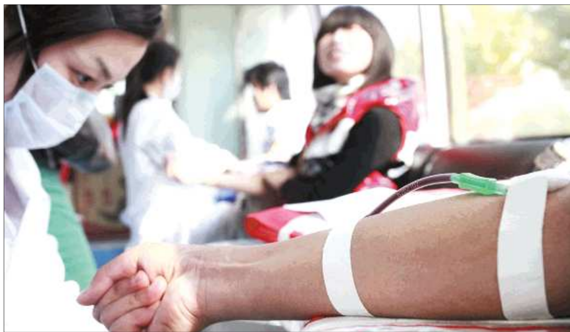
得知血库告急,聊城大学管理学院7名大三学生赶来献血。

“奉献的是爱心,挽救的是生命。”即日起,本报联合市中心血站发起献血倡议,开通两条献血热线8512907(血站)、8451234(本报),希望市民踊跃报名献爱心血。