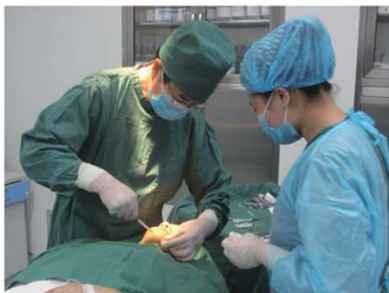
开展自体脂肪颗粒活性移植临床项目15000余项