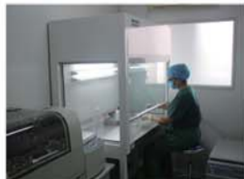
自体脂肪颗粒活性移植SVF提取实验室

9日,第四届国际自体脂肪美容艺术节于济南爱容整形医院盛大启幕,此前,济南爱容整形医院已经成功举办过三届自体脂肪美容艺术节。在历届自体脂肪美容艺术节中,明星佳丽、业界专家的参与让活动增添了观赏价值和学术价值,也为追求健康个性之美的求美人士提供了更加完善的互动平台。