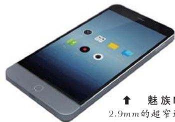
↑ 魅族MX3：拥有2.9mm的超窄边框，而且屏幕还具有PSR自动刷新技术，一展“宅寂之美”。