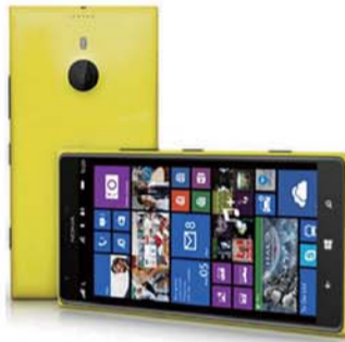
↑ 诺基亚Lumia 1520：这款神秘机型最大的特色是配有6英寸触控屏以及2000万像素摄像头，同样配有蔡司镜头和支持PureView技术，据悉她的神秘面纱将于9月26日揭开。