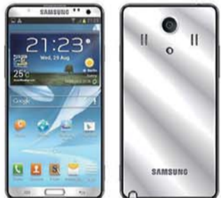
↑ 三星GALAXY Note 3：该机运行最新的Android 4.3系统，有炫酷黑、简约白、前卫粉三种机身颜色，据悉，本次开放预约的是移动、联通以及电信三个版本，而参考价格均为5699元。