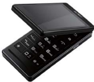
↓ 金立W800：这款双屏手写的智能手机适合中年商务人士，触摸手感出众，使用界面便捷，安全系数很高。