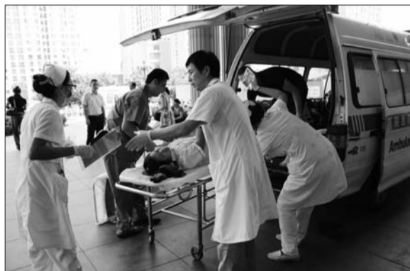
12日上午11点40分,受伤女工被救护车送到毓璜顶医院。

“像是升压药、降压药、平喘药、解毒药、利尿剂、退烧药都有。”赵丰清介绍,此外救护车里还有呼吸机、吸痰器等仪器,这基本能满足日常出诊的需要。