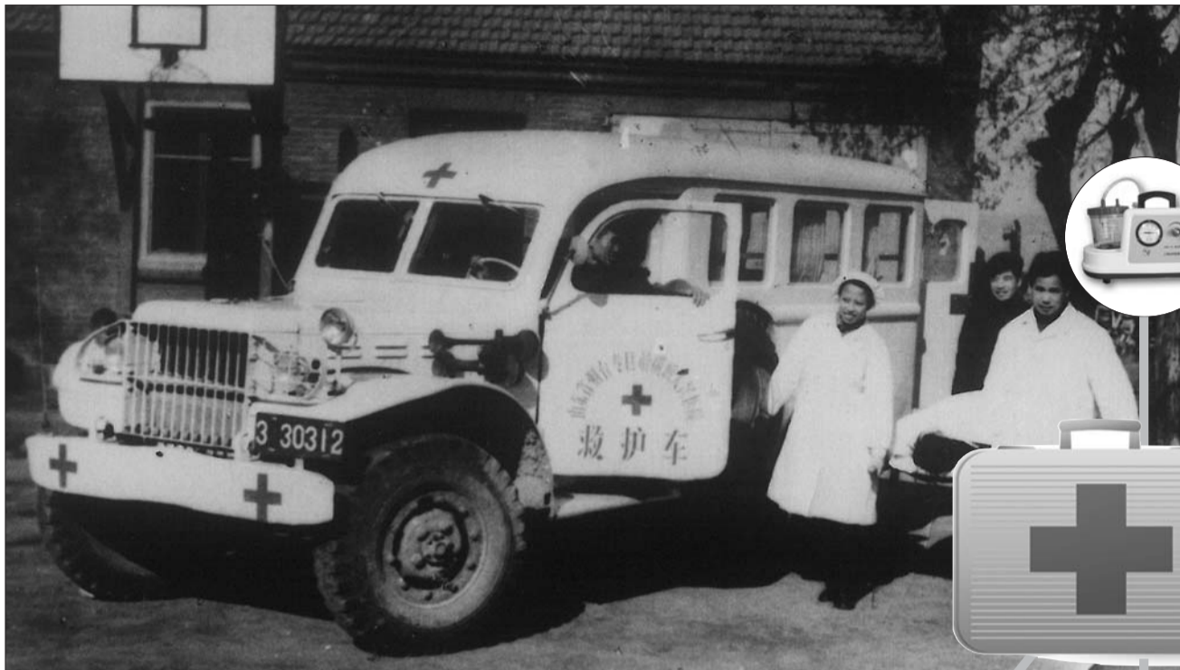
1951年,毓璜顶医院有了烟台第一辆救护车,这辆车是由美式吉普改造而成的。

每年9月的第二个周六是世界急救日。救护车载着急诊医护人员每天穿梭在城市的大街小巷,与病魔展开赛跑。9月14日是今年的世界急救日,在世界急救日前夕,记者探访了烟台120急救发展变化的历史,并跟随毓璜顶医院的急救人员体验了一次紧急出诊的全过程。