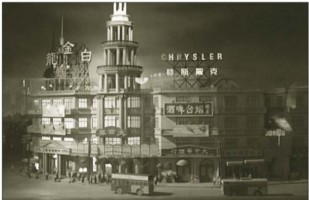
上海滩烟台啤酒广告