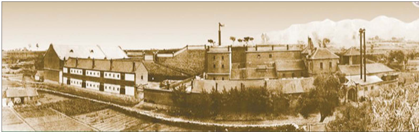
最早的烟台啤酒厂全貌