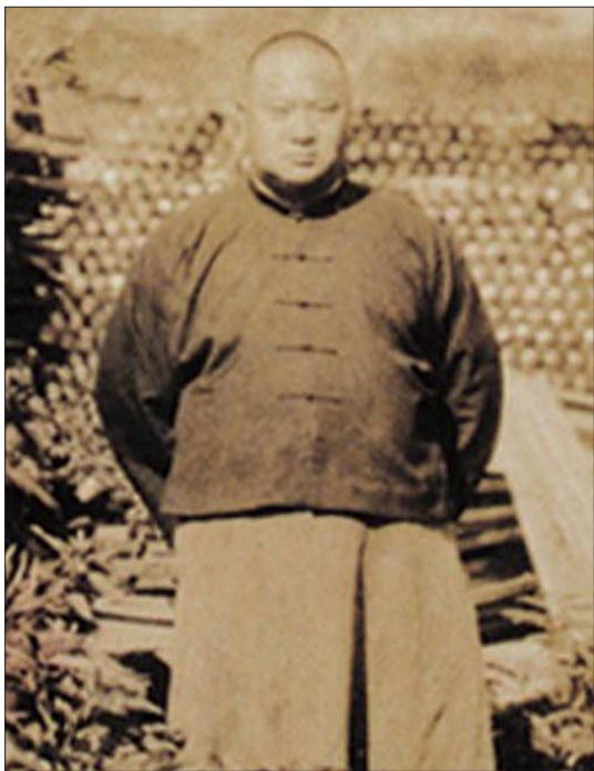
烟台啤酒创始人王益斋