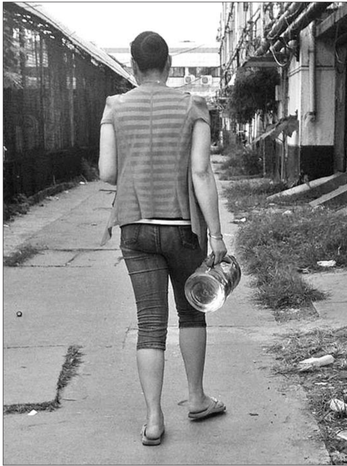
由于小区停水,很多住户选择买水喝。

郑先生说,现在正在征集大伙儿的意见,大概有七八成的居民觉得“一户一表”改造计划可行。改造计划实施的唯一问题就是改造费用比较高,就怕有些住户不愿意交钱。