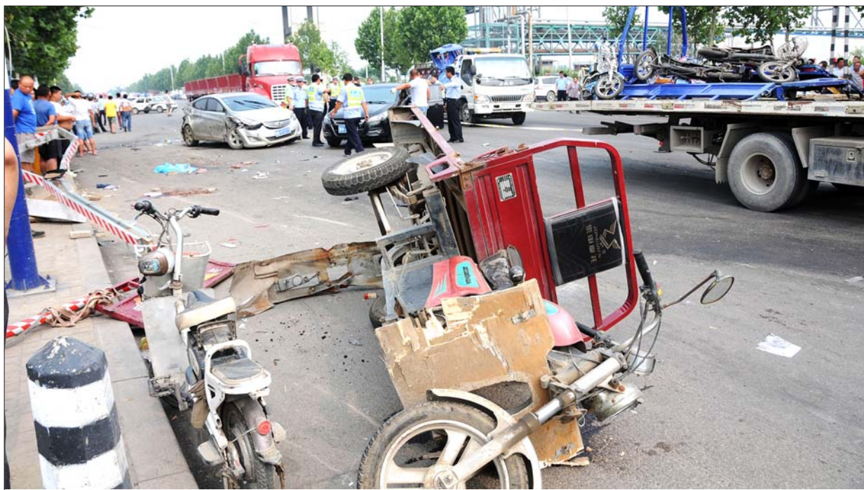
27日下午,在德州市区,一辆大货车冲向铁路道口等待火车通过的行人车辆,造成2死8伤。

本报德州6月27日讯(记者 王明婧 张磊) 27日13时40分左右,德州天衢西路华鲁恒升集团南门铁路道口发生一起严重的交通事故。一辆大货车撞坏碾过多辆正在铁路道口等待放行的机动车和非机动车,造成2死8伤。