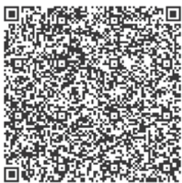
扫码看车祸救援现场视频。