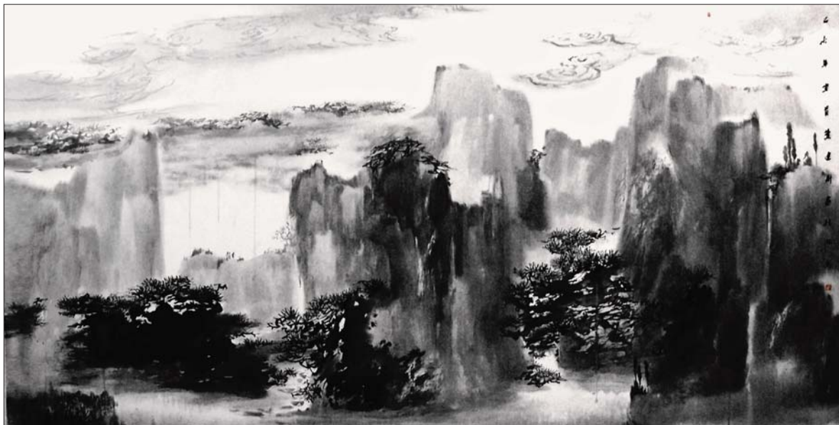
▲水墨山水 68x136cm 叶建新

9月16日,中国(淄博)课本博物馆大家境界美术馆,将迎来一场前所未有的视觉盛宴:藏·品——毕加索、叶建新中西方文明艺术展。此次展览,不仅将展示著名画家、中国陶瓷设计大师叶建新近百件绘画、陶瓷作品,还将展示西方艺术大师毕加索的部分陶瓷精品。通过两位大师艺术作品的碰撞与融合,打破时间和空间的限制,来实现中西方文明艺术的隔空对话。