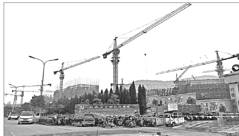
枣庄一楼盘正在紧锣密鼓建设。

枣庄9月份出台了《关于加强房地产市场调控工作的意见》,做出了上调首套房、二套房公积金首付比例,灵活确定住宅用地竞价方式,要求取得商品房预售许可证的项目,要在10日内一次性公开全部销售房源等。不过记者采访发现,受碧桂园集团在薛城区拿地的影响,市民对楼市的投资热情依然火热。