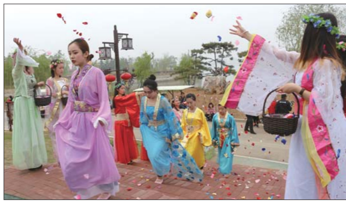
天頤湖泰山花朝节