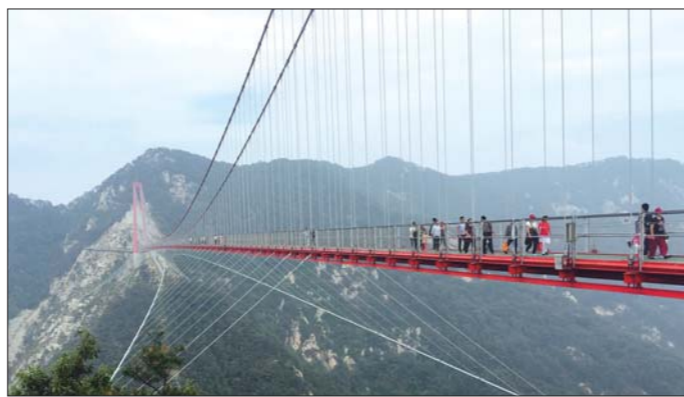
天蒙山世界第一人行懸索橋