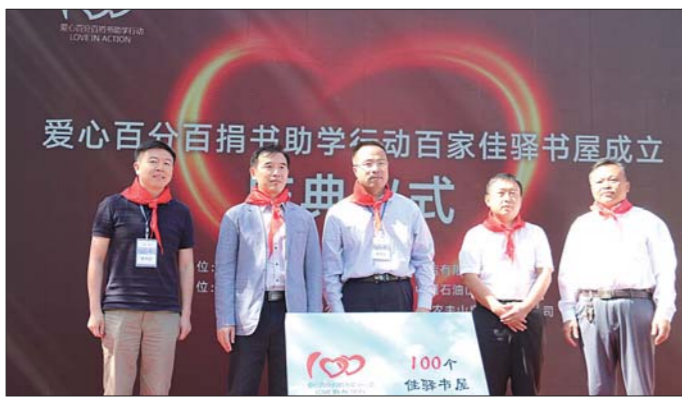
銀座旅遊愛心百分公益活動