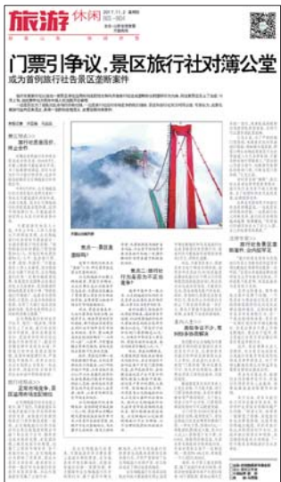
11月2日,齐鲁晚报B01版刊发的相关报道。

支持景区做法!曾经跟团旅游过,价格不高,结果到了景点不让多玩,到了购物店却浪费大把的时间,旅行社不会做亏本的生意,到景点赔钱做,肯定从其他方面补,直接影响游玩的心情。