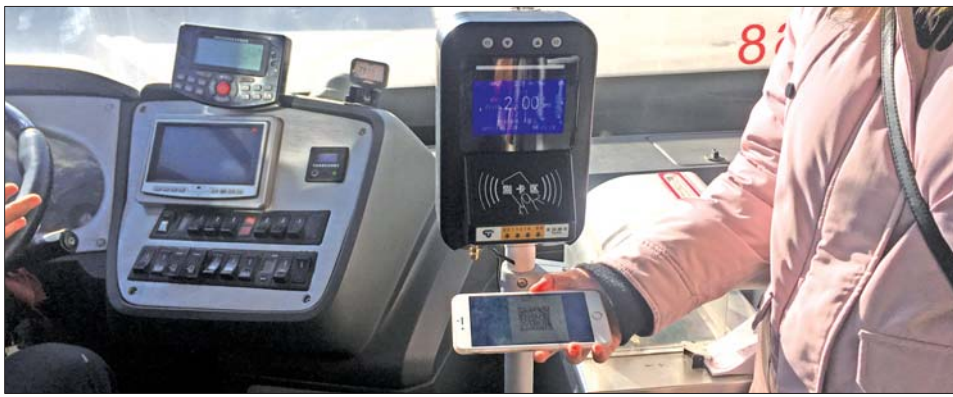
市民体验支付宝扫码支付。

据济南市公交总公司信息中心相关工作人员介绍,济南公交正全面推进“互联网+公交”,让数据代替人跑路,用数据协助智慧决策,改变传统的数据孤岛和信息壁