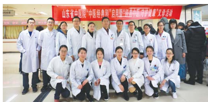
中医学经典科开诊并举行义诊活动