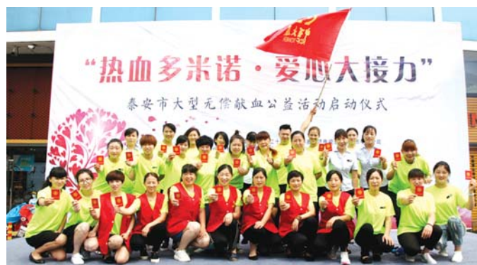
泰安市成功举办“热血多米诺 爱心大接力”公益献血活动。

接受。如今泰安市中心血站志愿服务地已经本实现志愿服务工作制度、规范、社和常态。“我们强了无偿献血志愿服务队的建设和管理,建立了可供志愿者开展培训、志愿服务动的‘志愿者之家’。”泰安市中心血站站长周林介绍,血站设定了献血宣传、献血招募、献血服务等服务岗位。