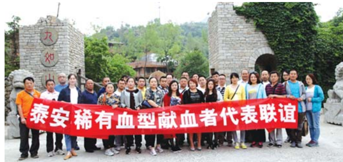
泰安市RH(-)稀有血型爱心联盟定期举办联谊活动,加强沟通交流。