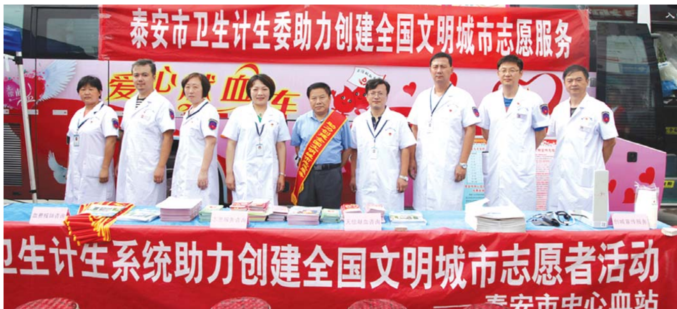
统一佩戴党徽和“红色天使 热血先锋”肩章的血站党员志愿者们参加助力创城志愿服务活动。