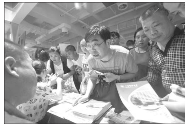
在山东省2018年高招会上,学生和正在进行志愿填报咨询。(资料片)

均录取分数538.4分。其中最高分为592分,比自主招生线高出75分;最低分502分,比自招线低15分。