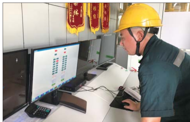
源根石化员工上岗前进行安全隐患排查。

据高新区安监局相关负责人介绍,下一步,除22家标杆企业外,还将在全区159家企业继续督促双重预防体系建设开展工作,推广信息平台的信息数据录入,确保双重预防体系建设工作的有效运行,并向纵深发展。