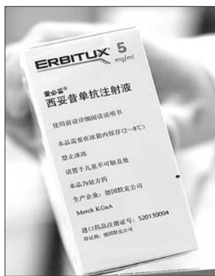
西妥昔单抗注射液由4200元降到1295元。

昂贵的靶向药,对于大多数工薪阶层的患者来说,是沉重的负担。但另一方面,它却日益成为很多肿瘤患者的主流用药和救命药。“真的好用。”10月