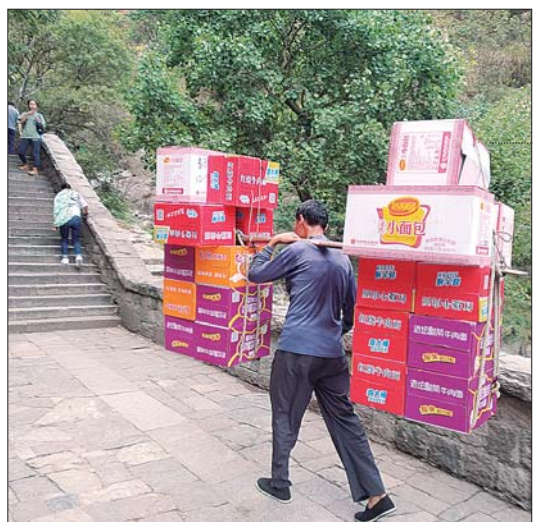
登山途中,载满货物的扁担,格外引人注目。