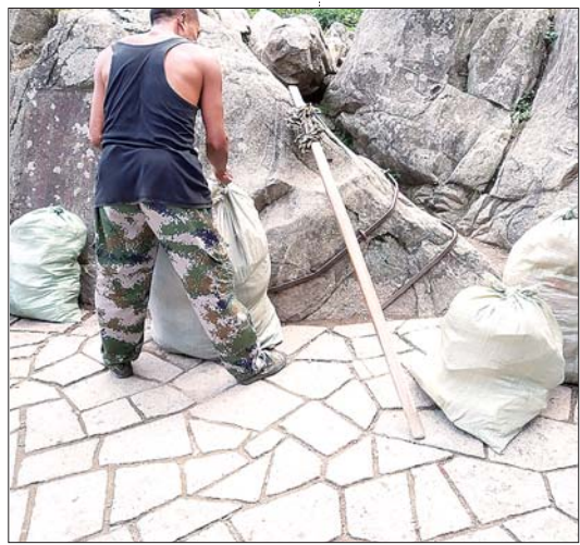
到达南天门后,挑山工将山上的垃圾再挑下山。

对于挑山工群体如何持续下去,王玉林表示,现在正在做将泰山挑山工纳入非物质文化遗产名录这项工作,但尚需时间。