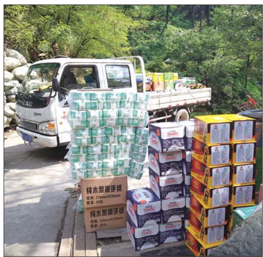
在中天门的起点处,堆放着即将挑送上山的货物。