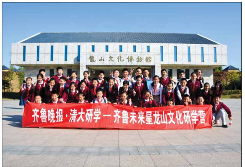
济南市纬二路小学六年级学生开启龙山文化研学之旅。

造与众不同而又专业的研学旅行。想在行走中收获知识,获得成长,就来参加齐鲁晚报·清大研学推出的“齐鲁未来星”研学游吧,您想参加的,我们这里都有,总有一款会适合你。