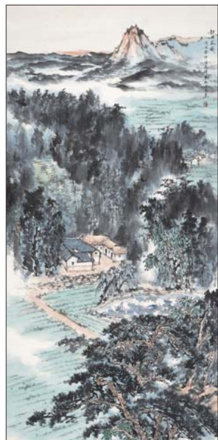
韶山晨曦 136x68cm 杨惠东