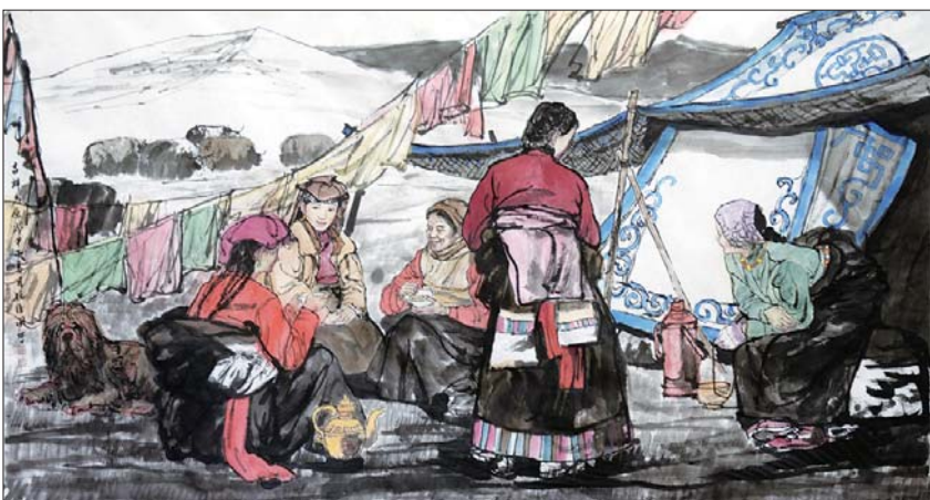
吉祥高原 180x97cm 孙维国