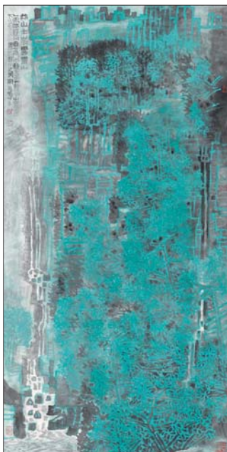
燕山主峰雾灵山 137x68cm 周石峰