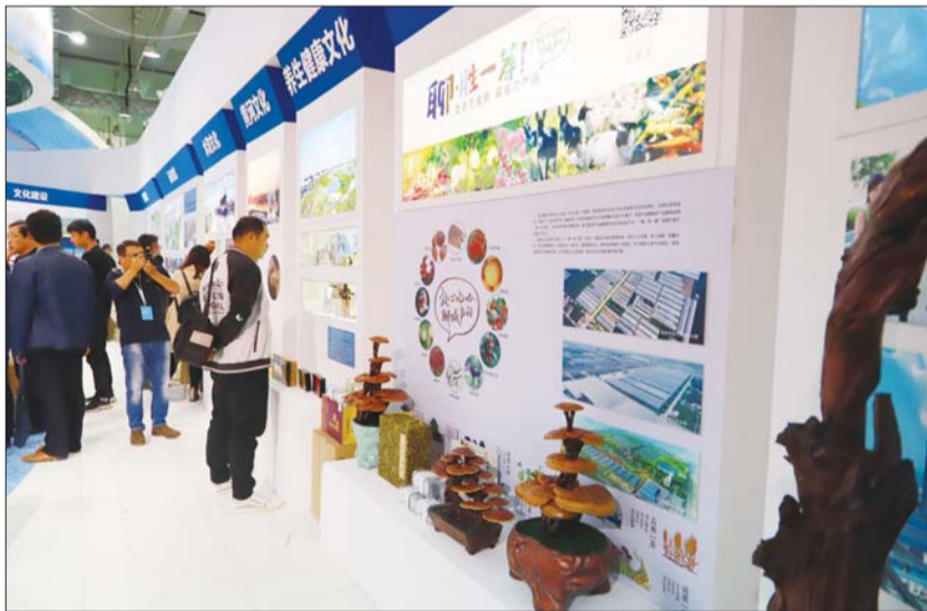
展区三大板块将展示聊城独特的文化魅力。