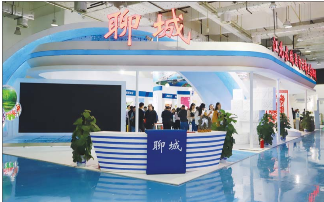
聊城展区已筹备就绪,静待客来。

聊城展区内部设置有文创空间,文创空间根据各地特点分为“葫芦之乡魅力东昌”、“生态家园绿色莘县”等11个部分,主要展示了聊城文创产业及文创产品。在“打虎故地英雄阳谷”部分,布展工作人员告诉记者,这次文博会他们带来了烙画、武大郎炊饼等产品,颇具传统特色。