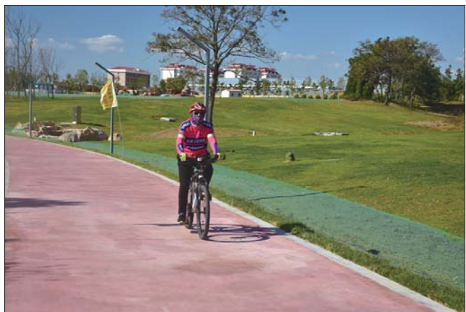
优美的环境和清新的空气,吸引了人们来此健身。