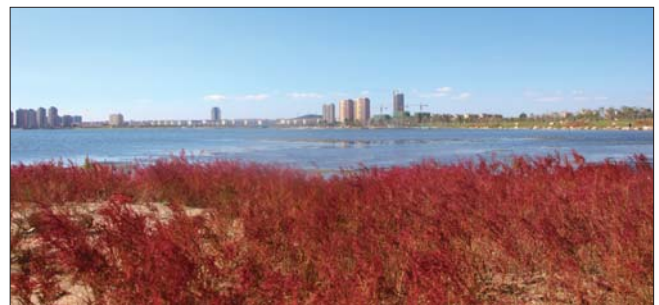
耐盐碱的红色碱蓬。

为了最大化恢复潮汐湖生态环境,在生态修复中,乳山市坚持坚持了“三不”原则,不建设硬质堤岸,不大面积硬质铺装,不大规模换土。实施湖内清淤,增加水体交换能力,营造咸淡水湿地生态系统,保留原有芦苇湿地和潮汐发电站,修复和涵养潮间带滩涂。