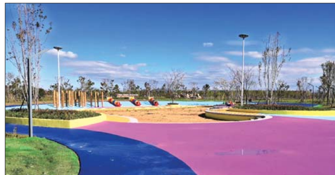
铺设了环保材料的儿童乐园。

然而,让人赞叹的潮汐美景也曾遭遇危机,由于历史原因,湖内淤泥沉积,周边滩涂杂草丛生,湖内遗留的一些养殖作业,也给湖区生态环境带来威胁,逼迫原有湿地面积逐渐萎缩。