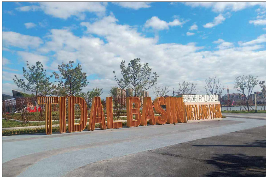
乳山潮汐湖湿地公园。

近年来,乳山市一直秉承“绿水青山就是金山银山”的发展理念,积极推进生态文明建设,采取了PPP的运作模式,引进国内知名综合性园林龙头企业——岭南生态文旅股份有限公司,对潮汐湖进行生态提升建设,打造生态保护、旅游观光、休闲娱乐、科普教育于一体的综合性湿地公园,实现了自然环境与美好人居的和谐。