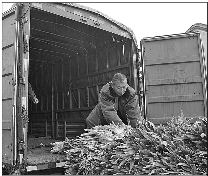
11月8日,在得知莱芜市羊里镇玄王石村的莒苣滞销情况后,青岛、烟台等地的采购商纷纷伸出援手。