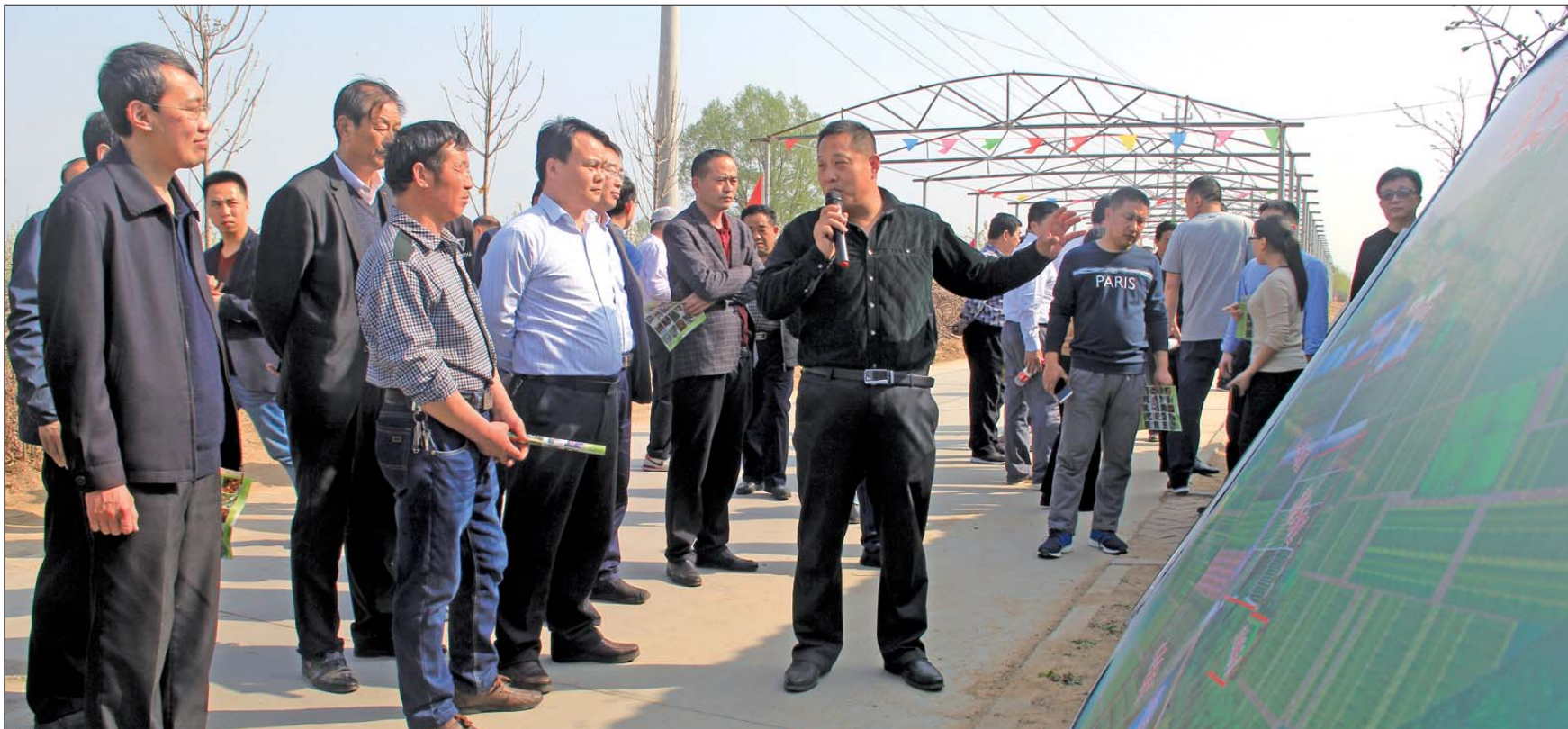
党建观摩周孟黄河风情园。